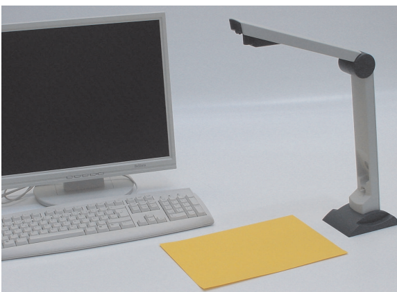
Kaufpreis: auf Anfrage

Haben Sie Ihr Archiv digitalisiert, können Sie überlegen, ob Sie Ihren "Papierkram" weiterhin aufheben oder einfach entsorgen. Der Platzbedarf einer CD oder DVD ist erheblich geringer als zahlreiche Papierordner.